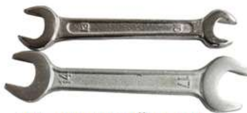
12 - Гаечный ключ