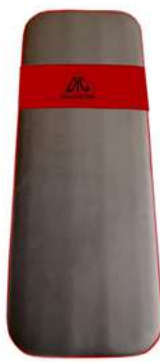
3 - Спинка