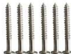
11 - Винт