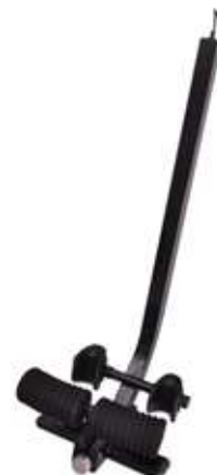
4 - Фиксатор для ног