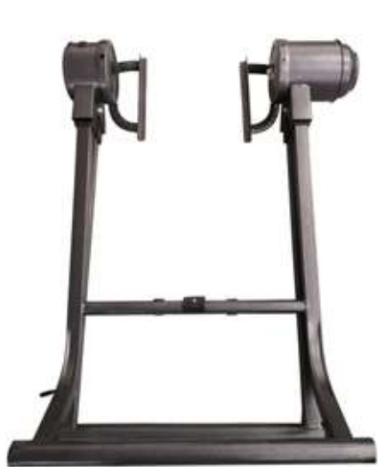
1 - Главная рама