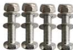
10 - Болт (в комплекте с шайбой и гайкой)