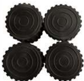
5 - Заглушка