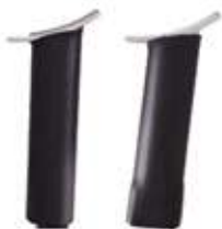
7-1 - Левая рукоятка