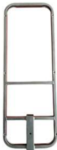
2 - Держатель спинки