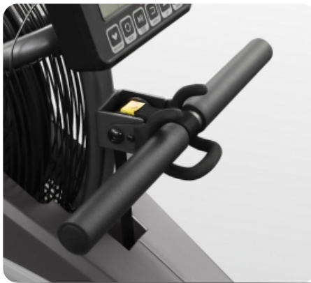
Рукоятки увеличенного размера