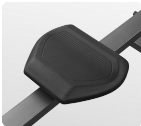
Сиденье повышенной комфортности