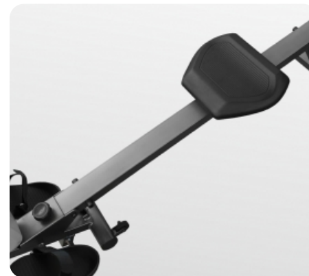
Удлинненный рельс для тренировок пользователей разной комплекции