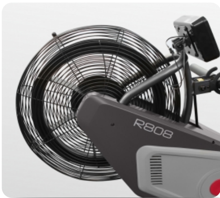
Аэродинамическая система нагружения

Теги: Домашние гребные тренажеры , Гребные тренажеры Carbon