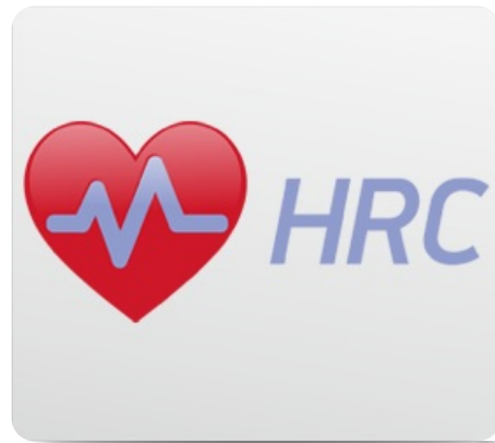
Встроенный в консоль беспроводной приемник частоты сердечного пульса