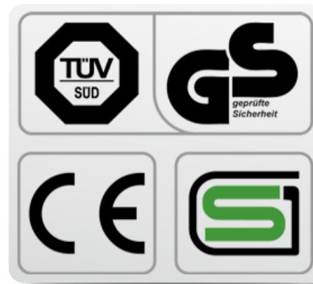
Обязательные сертификаты: европейский CE, немецкий GS TÜV, японский SG