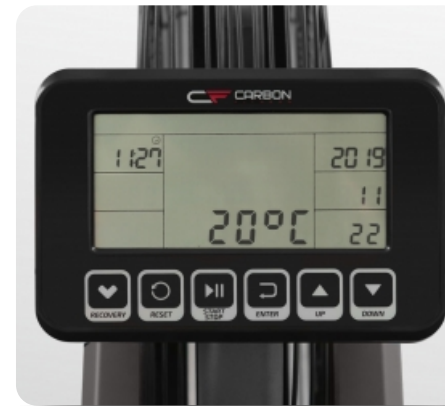
Черно-белый LCD дисплей диагональю 5.5 дюйма (14 см.)