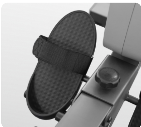
Большие педали с фиксирующими ремешками